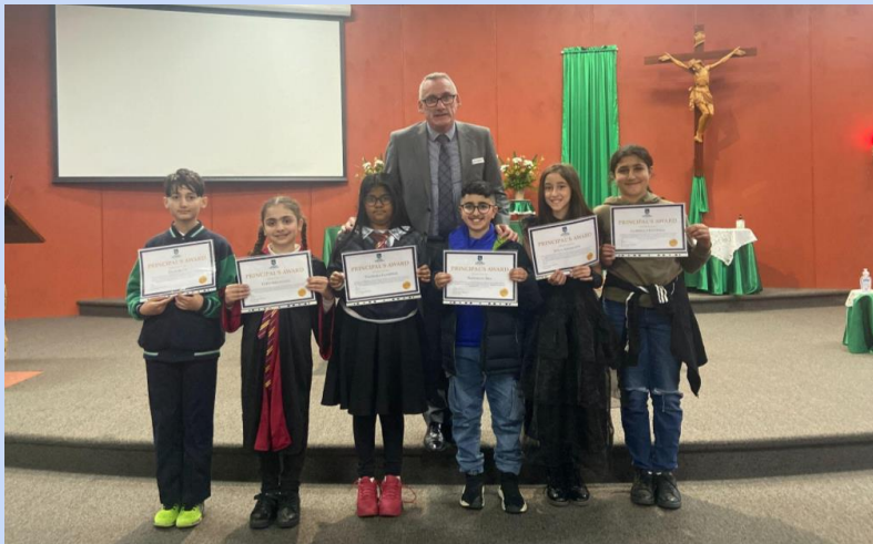
Nashwan - 5 White Lord - 4 White Leonardo - 4 White